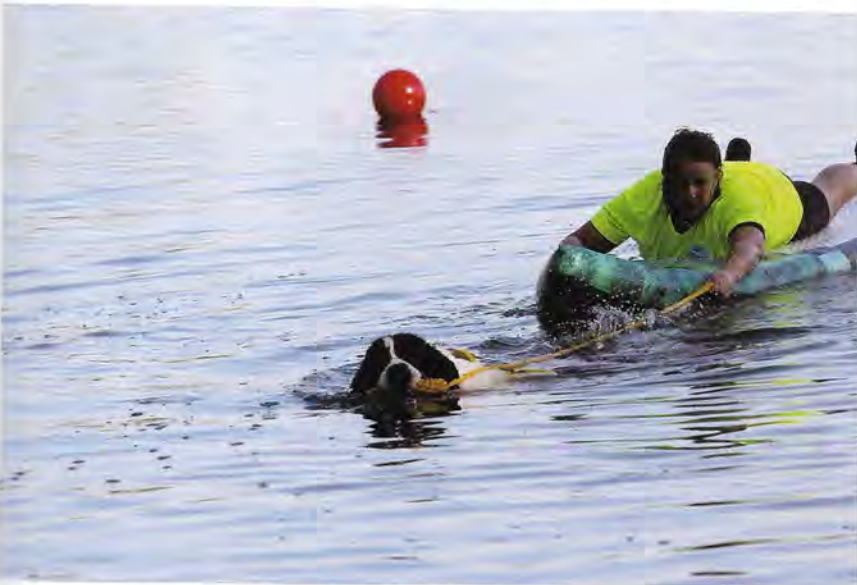
Gamma Filutki Chorzowskie